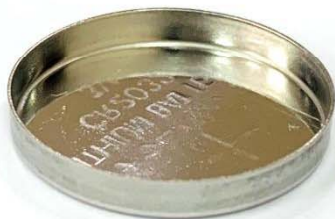
コインセルケース