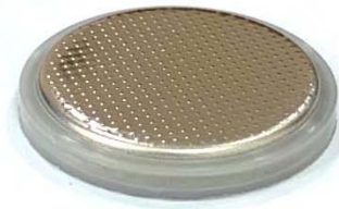
コインセルキャップ