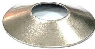
スプリングワッシャー