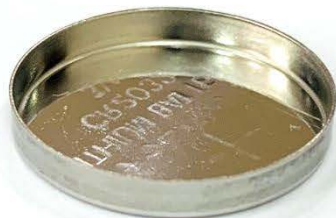
Bottom Case (Positive Case)