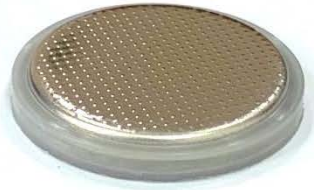
Upper Cap (Negative Case )